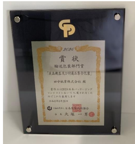
授与された表彰盾（輸送包装部門賞）