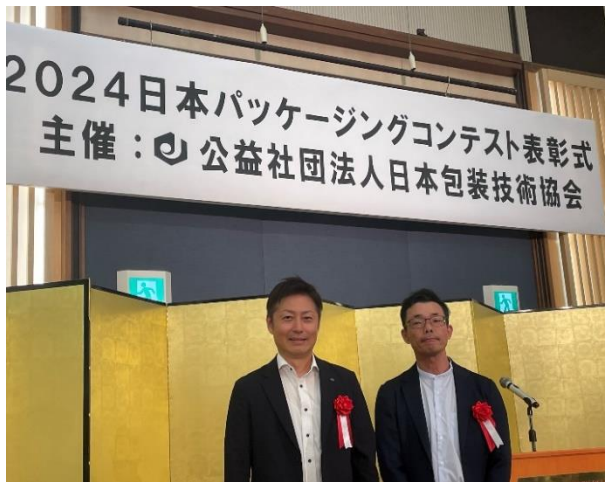
受賞作品の担当者 2 名

このたび、田中紙業では公益社団法人日本包装技術協会主催の『2024 日本パッケージングコンテスト』にて、「輸送包装部門賞」及び「工業包装部門賞」の2部門を受賞いたしました。昨年、初エントリー時の「工業包装部門賞」受賞に続き、2年連続の受賞となります。